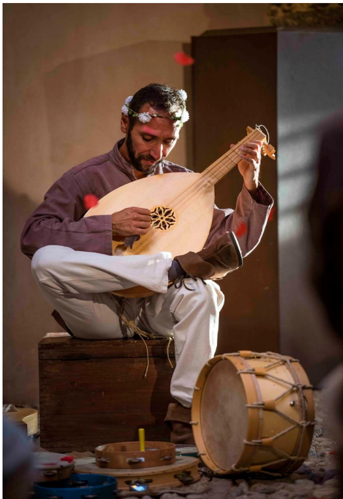
Netrio da Creta

Un giorno sente suonare una citola da un menestrello e si innamora di quel meraviglioso strumento a corde. Netroio deciderà di seguire il menestrello, che si imbarcherà per la Sicilia, per imparare a suonare quel curioso strumento. Durante il viaggio, però, la zattera si rovescia e prima che il menestrello venga inghiottito dal mare, affida il suo strumento al suo allievo. Il giovane Netroio, naufragato sulla costa siciliana, privo di forze, viene aiutato dal giullare Sepillo, con il quale intraprenderà un lungo viaggio.